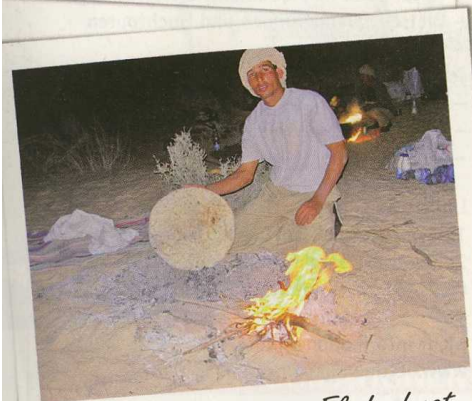
Selbst gemachtes Fladenbrot